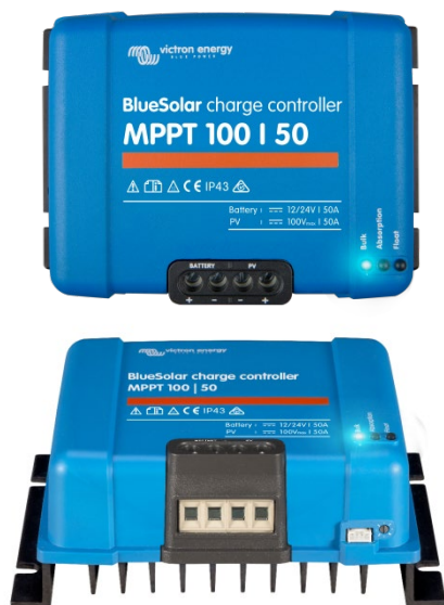
Solar Charge Controller MPPT 100/50